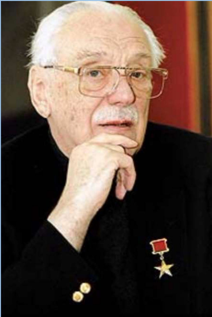
Сергей Владимирович Михалков (1913 – 2009)