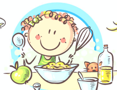
СЛЕДУЙТЕ ПРИНЦИПАМ ЗДОРОВОГО ПИТАНИЯ И ВОСПИТЫВАЙТЕ ПРАВИЛЬНЫЕ ПИЩЕВЫЕ ПРИВЫЧКИ