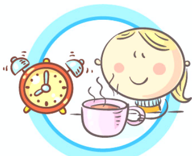
СОБЛЮДАЙТЕ ПРАВИЛЬНЫЙ РЕЖИМ ПИТАНИЯ