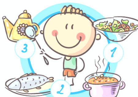
НЕ ПРОПУСКАЙТЕ ПРИЕМЫ ПИЩИ